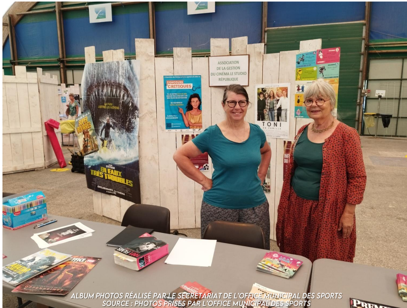
ALBUM PHOTOS RÉALISÉ PAR LE SÉCRÉTARIAT DE L'OFFICE MUNICIPAL DES SPORTS