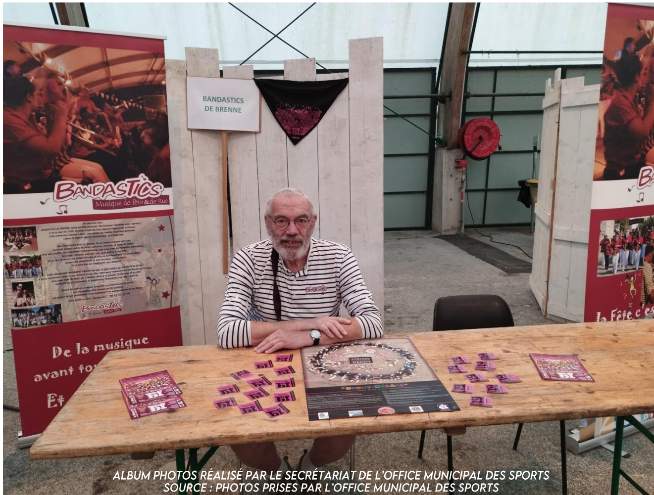
ALBUM PHOTOS RÉALISÉ PAR LE SECRÉTARIAT DE L'OFFICE MUNICIPAL DES SPORTS