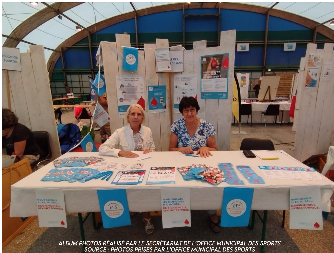
ALBUM PHOTOS RÉALISÉ PAR LE SECRÉTARIAT DE L'OFFICE MUNICIPAL DES SPORTS