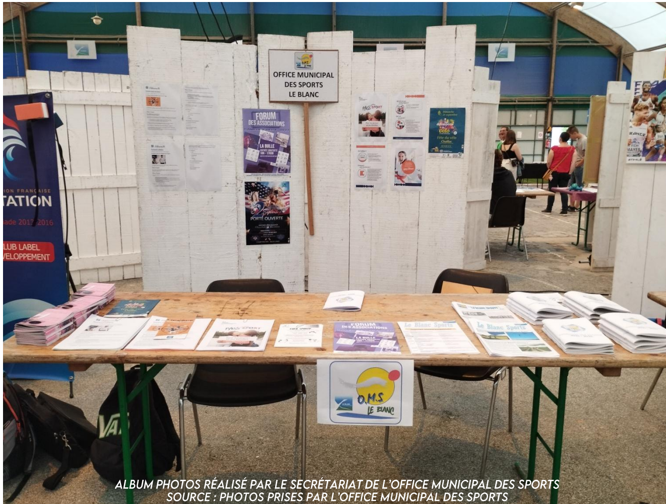
ALBUM PHOTOS RÉALISÉ PAR LE SECRÉTARIAT DE L'OFFICE MUNICIPAL DES SPORTS