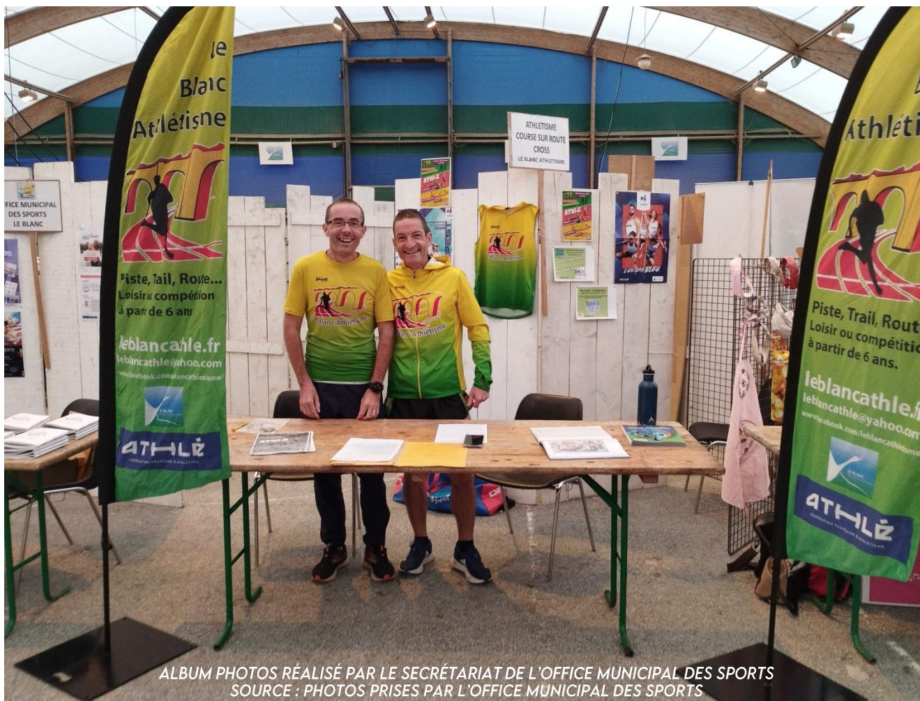
ALBUM PHOTOS RÉALISÉ PAR LE SECRÉTARIAT DE L'OFFICE MUNICIPAL DES SPORTS