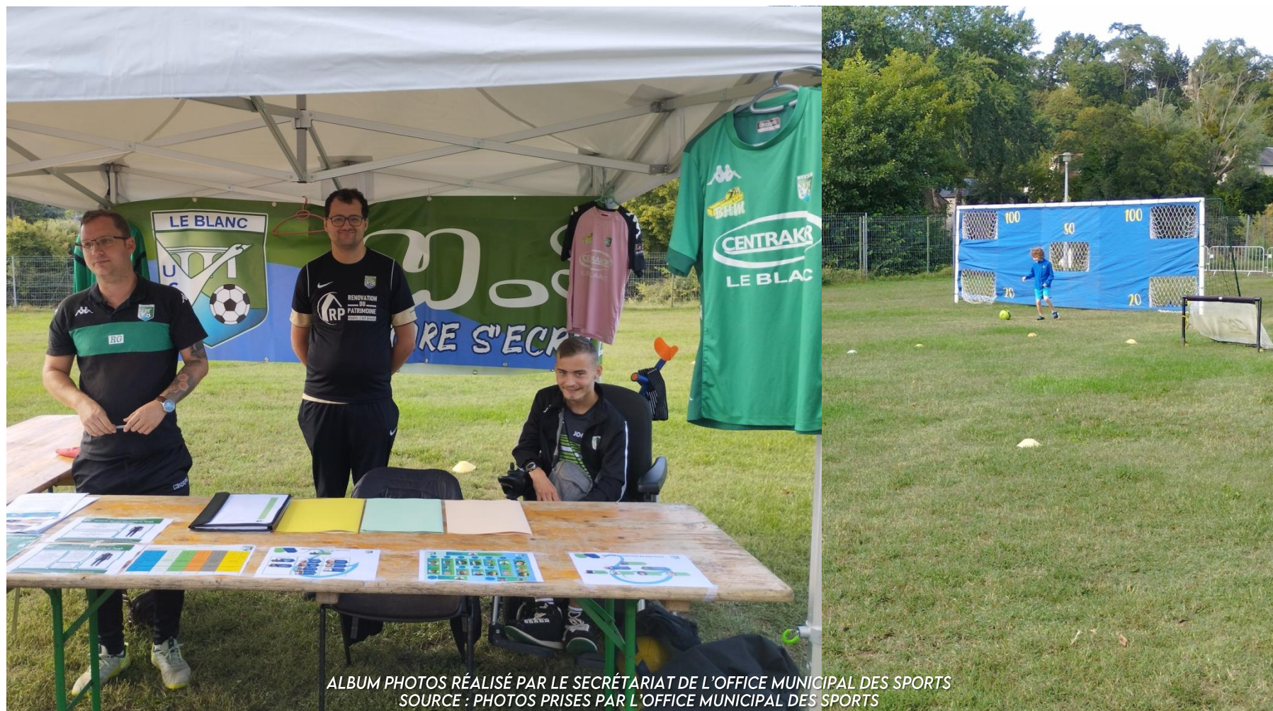
ALBUM PHOTOS RÉALISÉ PAR LE SECRÉTARIAT DE L'OFFICE MUNICIPAL DES SPORTS