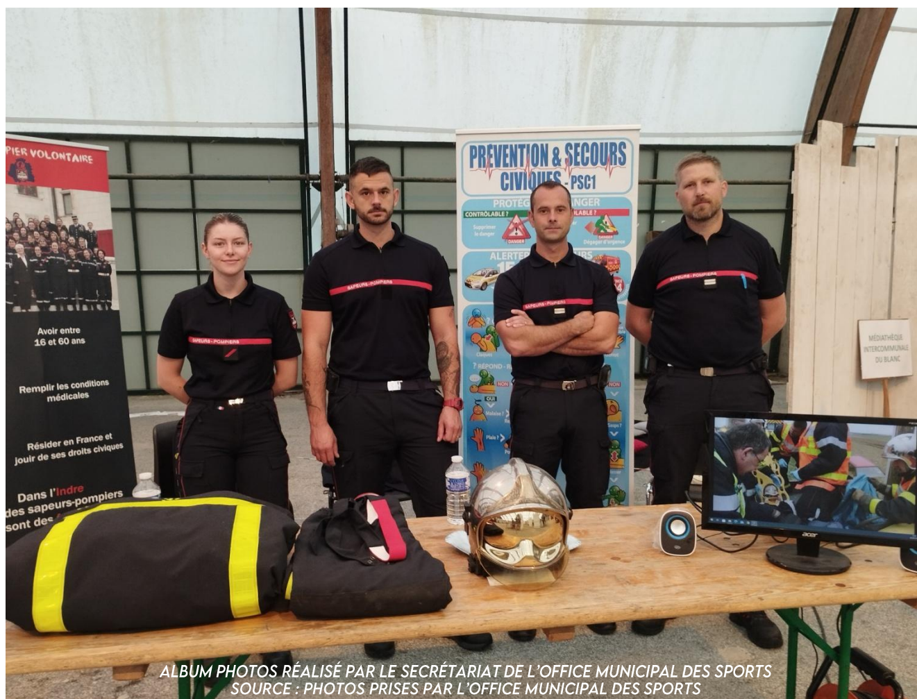
ALBUM PHOTOS RÉALISÉ PAR LE SECRÉTARIAT DE L'OFFICE MUNICIPAL DES SPORTS