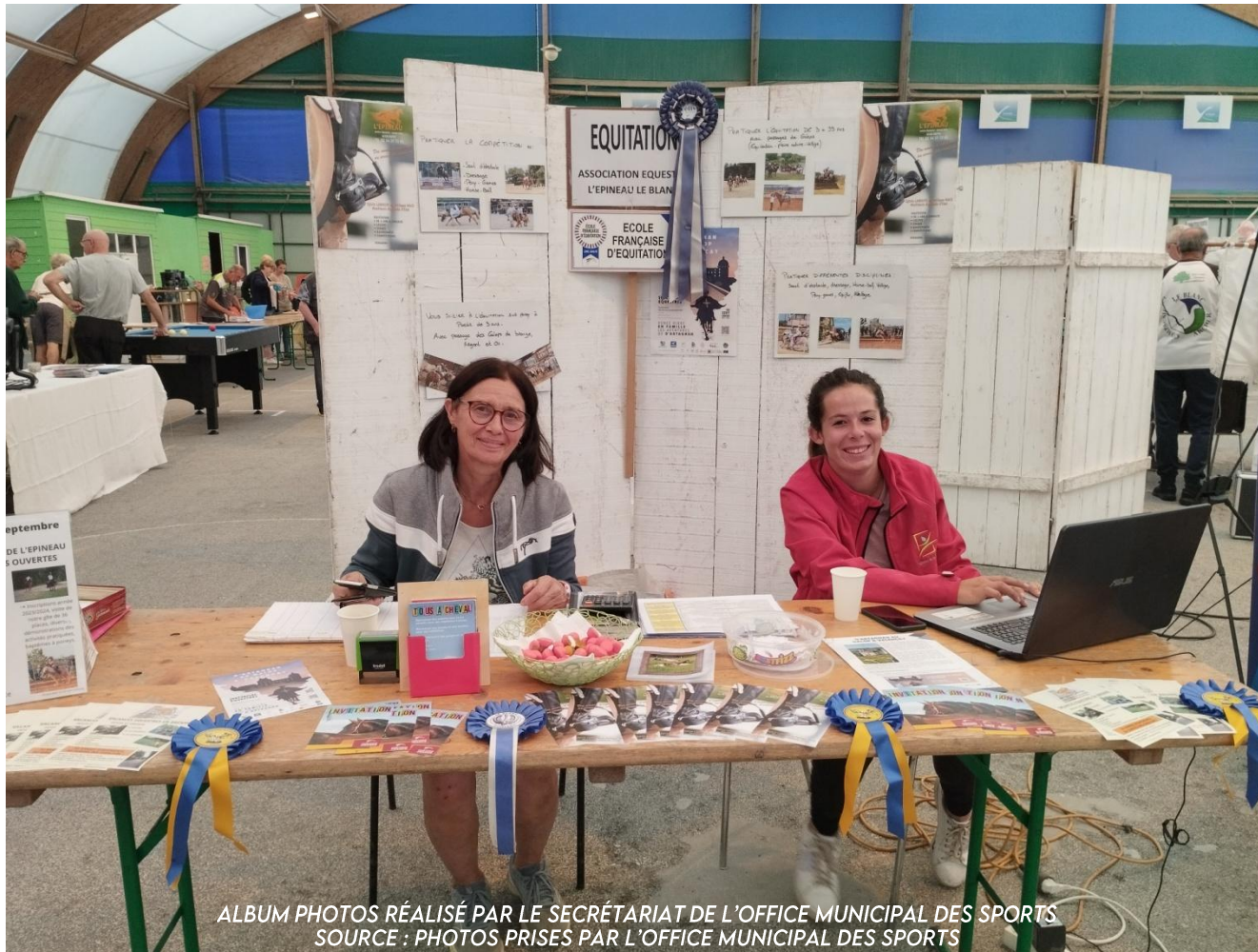
ALBUM PHOTOS RÉALISÉ PAR LE SECRÉTARIAT DE L'OFFICE MUNICIPAL DES SPORTS