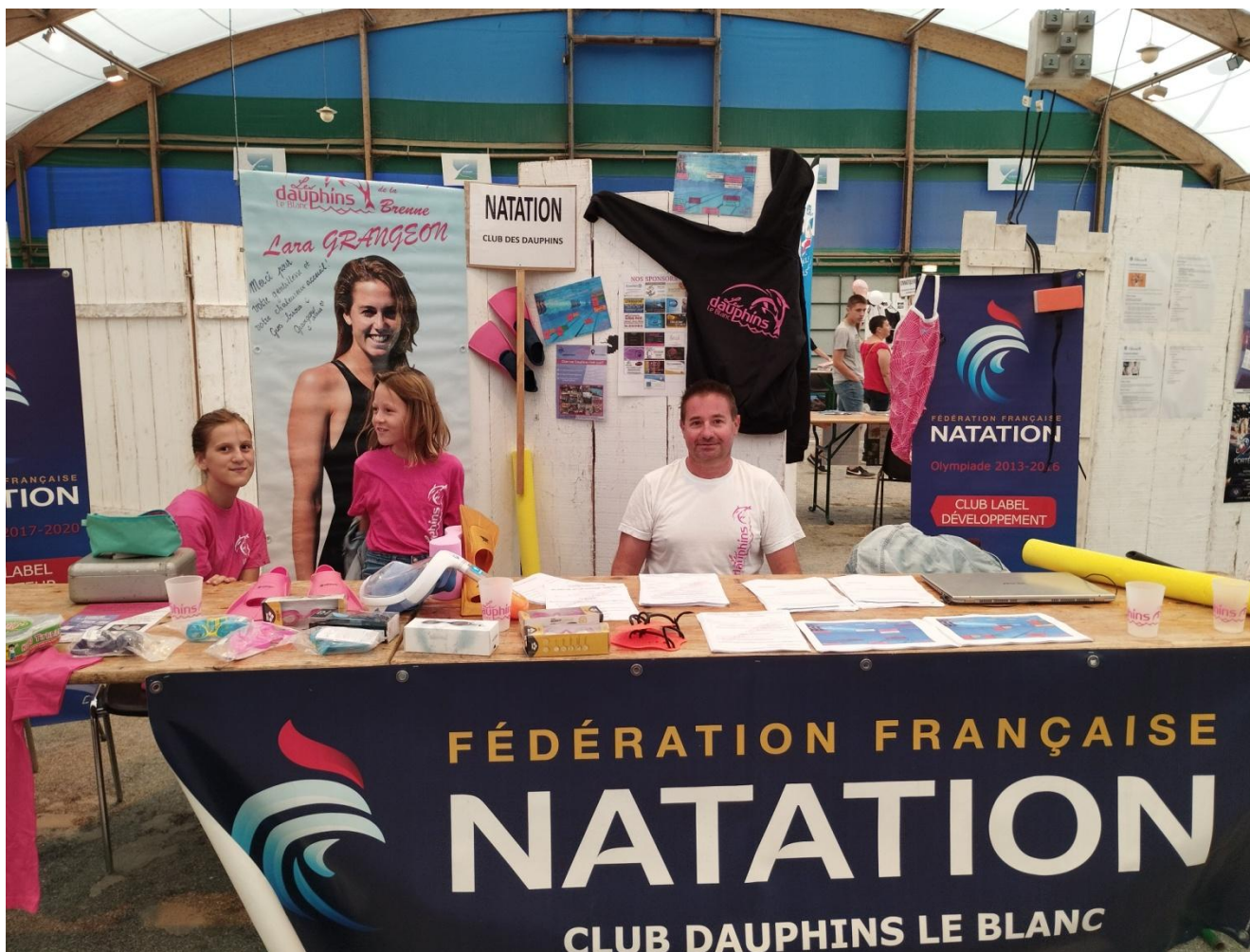
ALBUM PHOTOS RÉALISÉ PAR LE SECRÉTARIAT DE L'OFFICE MUNICIPAL DES SPORTS