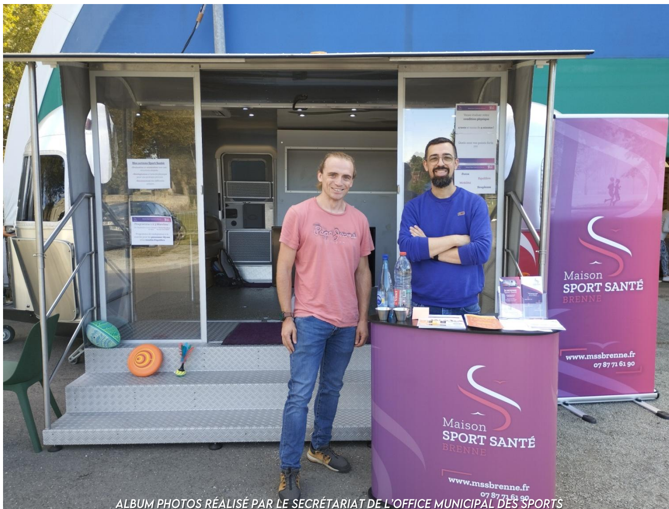
ALBUM PHOTOS RÉALISÉ PAR LE SECRÉTARIAT DE L'OFFICE MUNICIPAL DES SPORTS SOURCE : PHOTOS PRISES PAR L'OFFICE MUNICIPAL DES SPORTS