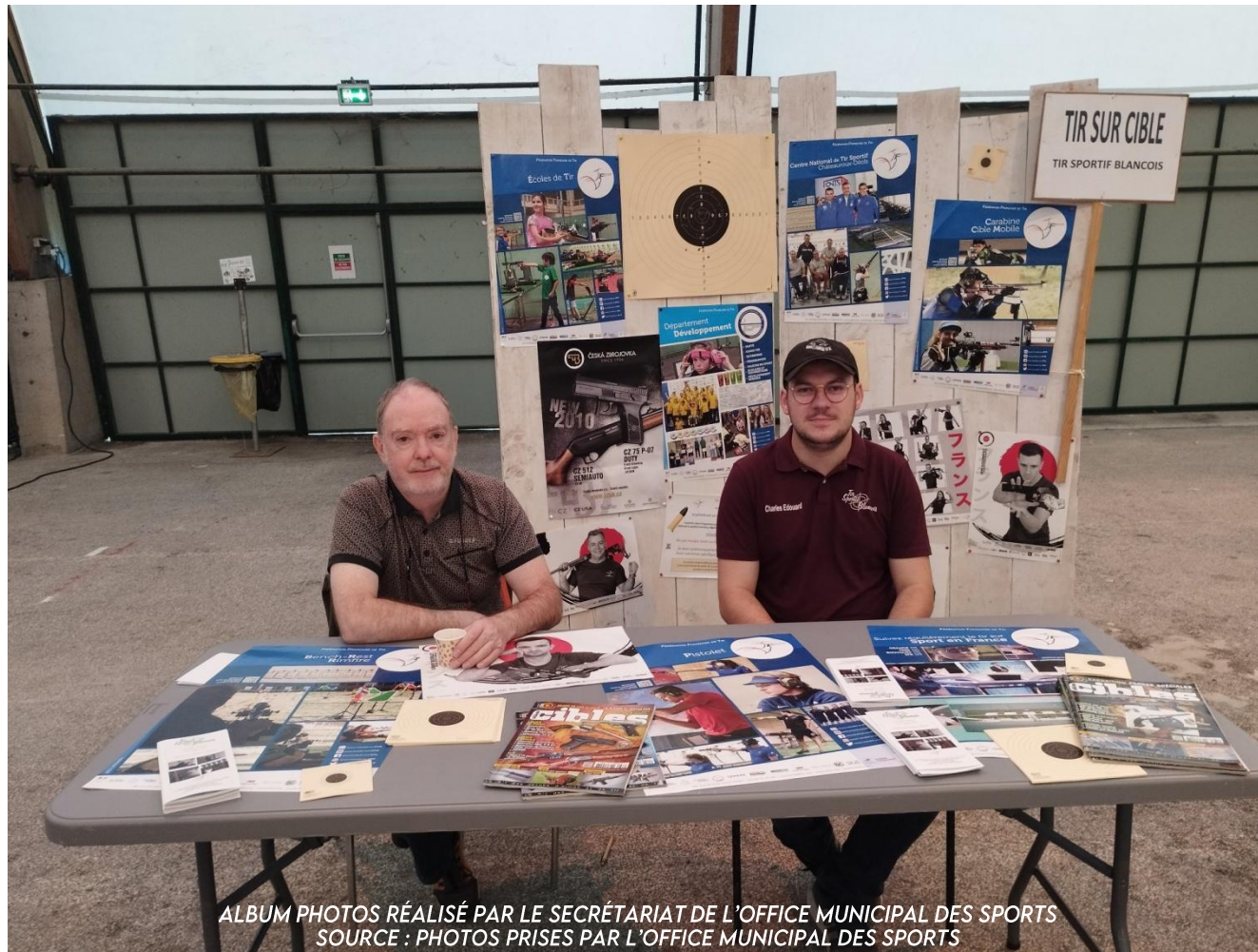
ALBUM PHOTOS RÉALISÉ PAR LE SECRÉTARIAT DE L'OFFICE MUNICIPAL DES SPORTS