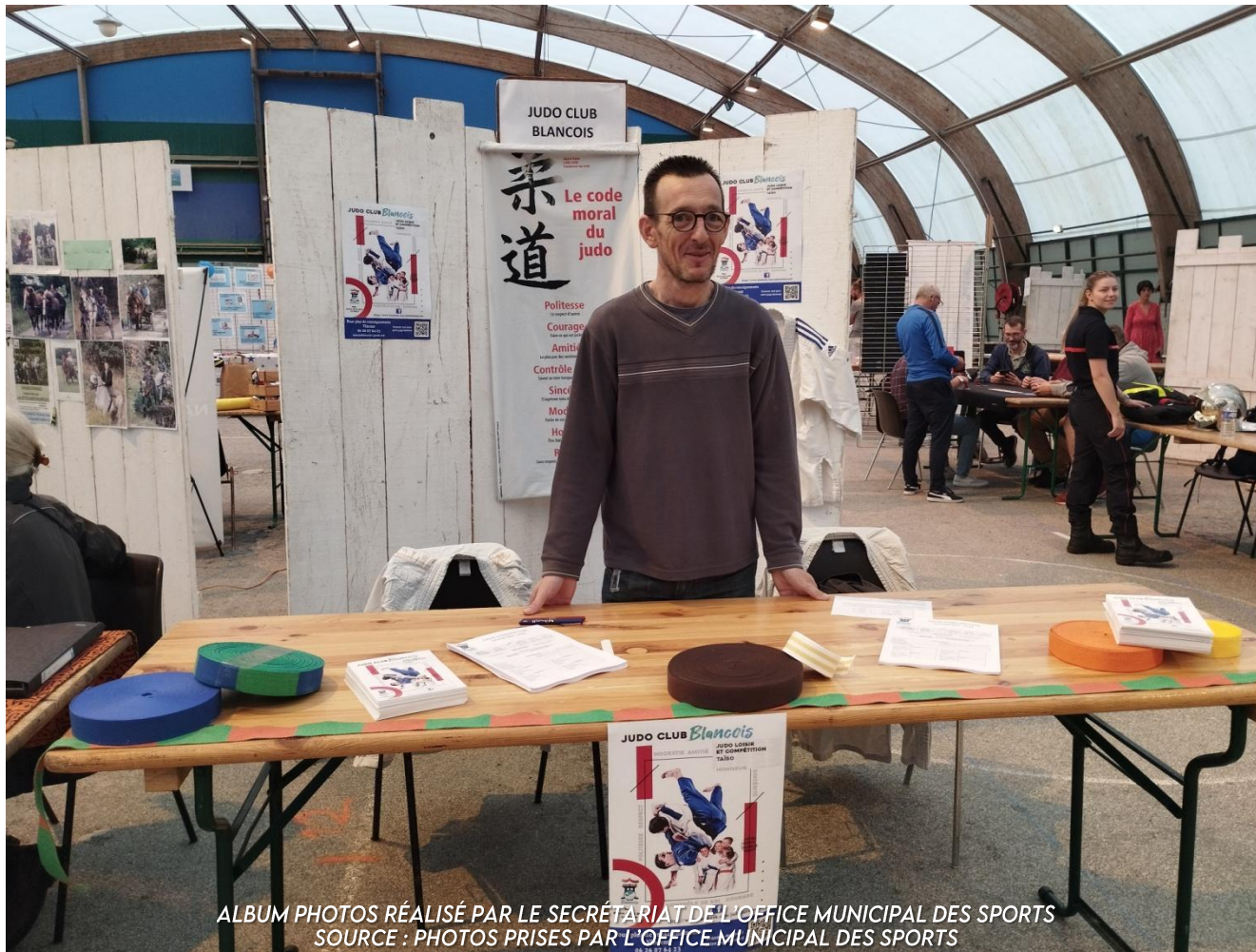
ALBUM PHOTOS RÉALISÉ PAR LE SECRÉTAIRIAT DE L'OFFICE MUNICIPAL DES SPORTS