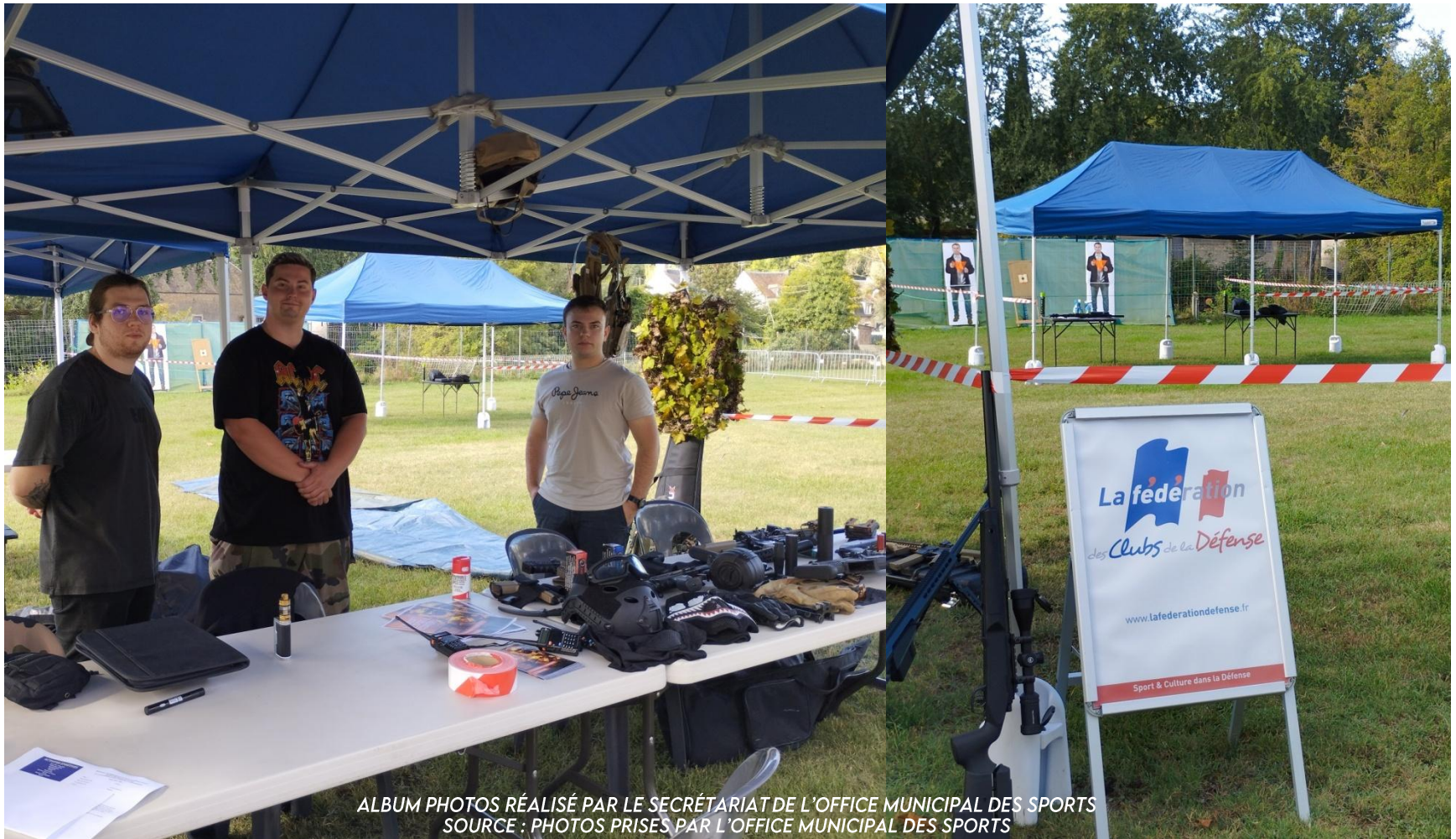
ALBUM PHOTOS RÉALISÉ PAR LE SECRÉTARIAT DE L'OFFICE MUNICIPAL DES SPORTS SOURCE : PHOTOS PRISES PAR L'OFFICE MUNICIPAL DES SPORTS