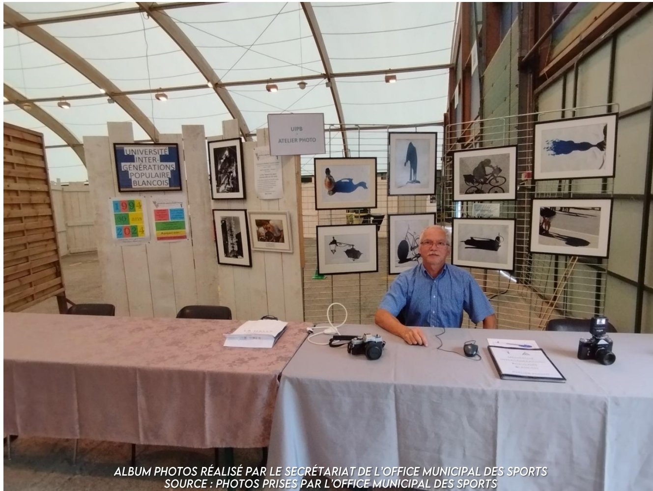
ALBUM PHOTOS RÉALISÉ PAR LE SECRÉTARIAT DE L'OFFICE MUNICIPAL DES SPORTS