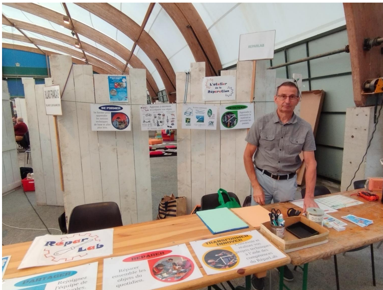
ALBUM PHOTOS RÉALISÉ PAR LE SECRÉTARIAT DE L'OFFICE MUNICIPAL DES SPORTS